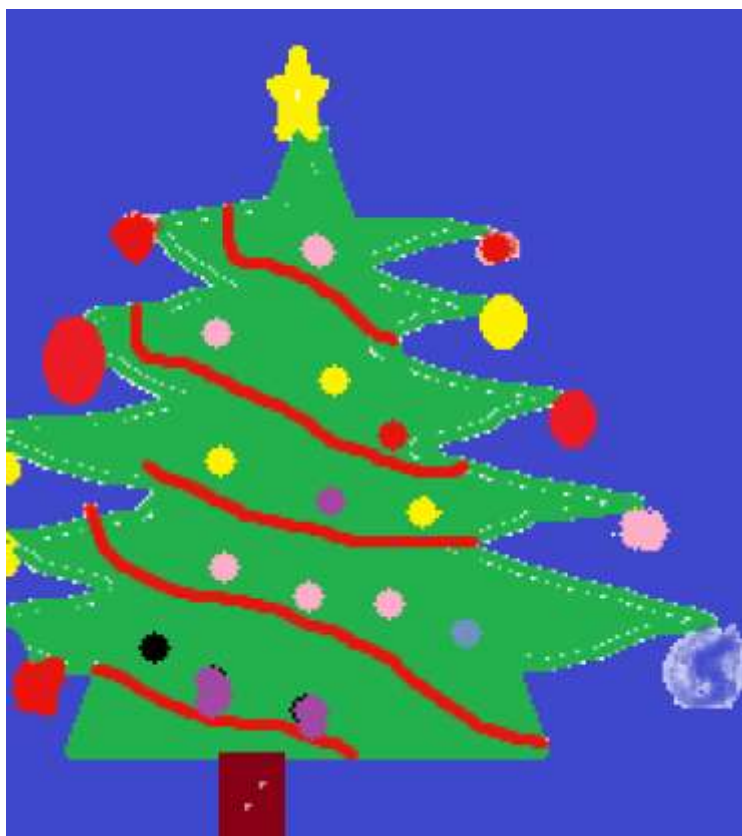
Rys. Szymek Pękala z kl. 2 c