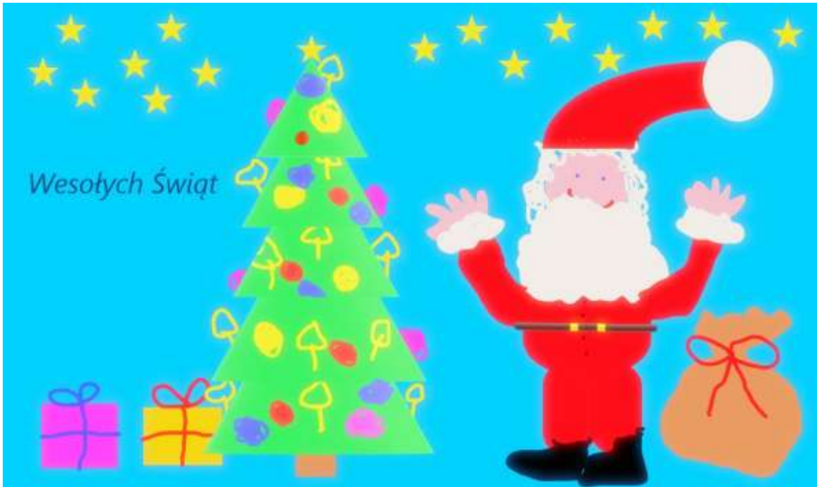
Kacper Dymek kl. 2 c